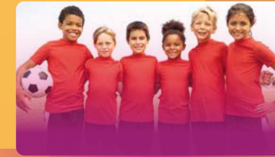
CATEGORÍAS Y MODALIDADES PARA NIÑOS Y NIÑAS

$650.00 DLLS $650.00 DLLS $650.00 DLLS $650.00 DLLS $650.00 DLLS $650.00 DLLS $650.00 DLLS $650.00 DLLS